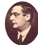
Gróf Klebelsberg Kuno