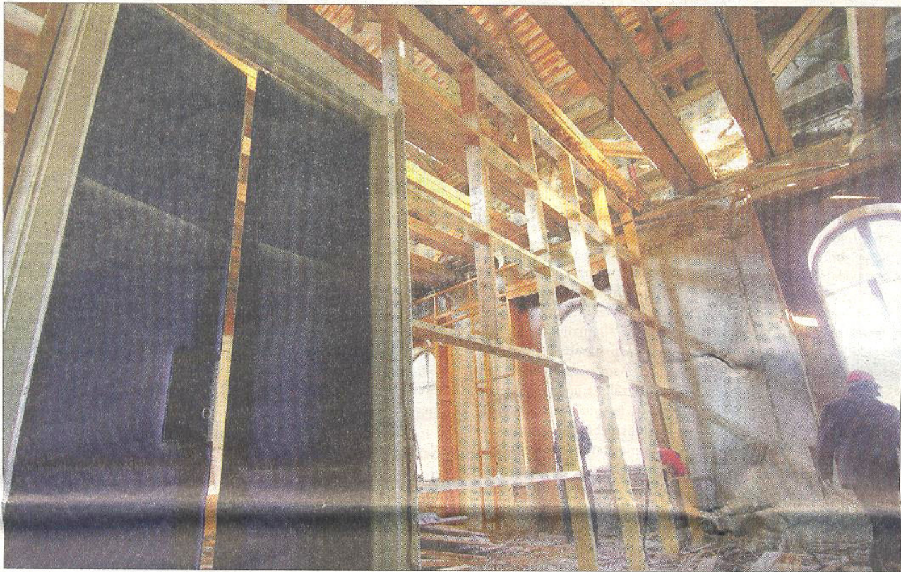
Már javában folyik a munka a Dugonics téri központi épületben.

Pályázati támogatással javulnak az oktatás, kutatás és gyógyítás körülményei