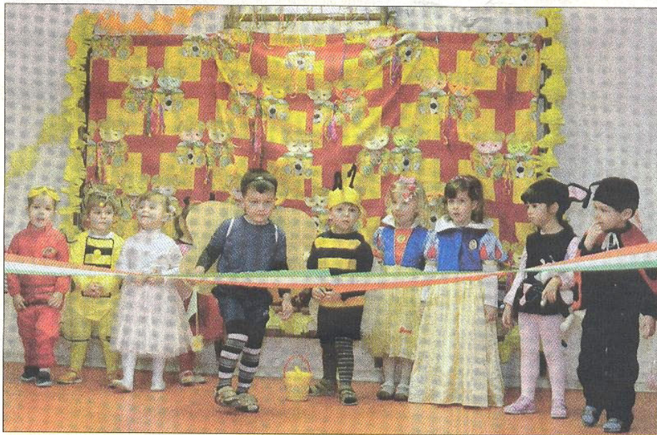
Szalagátvágás helyett szakítás a farsangi avatáson. Fotó: szegy

A 2009 nyarán elkezdődött munkák során kívül-belül megszórták a Batthyány utcában található régi építésű háromszobás családi ház. A korábbi terasz helyén elkészült egy új csoportszoba, a tornatermet alászigetelték, új irodával, a pincészinthen pedig szemináriumi helyiséggel, valamint egy, a hallgatók számára kialakított öltözővel bővült az épület. Itt készült el a zsibongó is, amelynek nevét először meghalva az ovisok persze hatalmas hangzavart csaptak. A helyiségek festése, a parketták csiszolása mellett felújították a mosdóhelyiségeket, és elkészült a tornaterembe vezető fedett lépcsőház is. A felújított tornaterem, ahova új sportpadló is került, nem csak a gyerekek napirendjében rendszeres mozgáshoz biztosít tágas és esztétikus környezetet, itt tartják